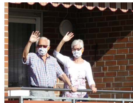
Gut geschützt: Der Hospizdienst versorgte die Mieterinnen und Mieter zahlreicher Seniorenwohnanlagen mit Nase-Mund-Masken, zum Beispiel das Haus 'Wohnen im (Un)Ruhestand' in Herne-Mitte.